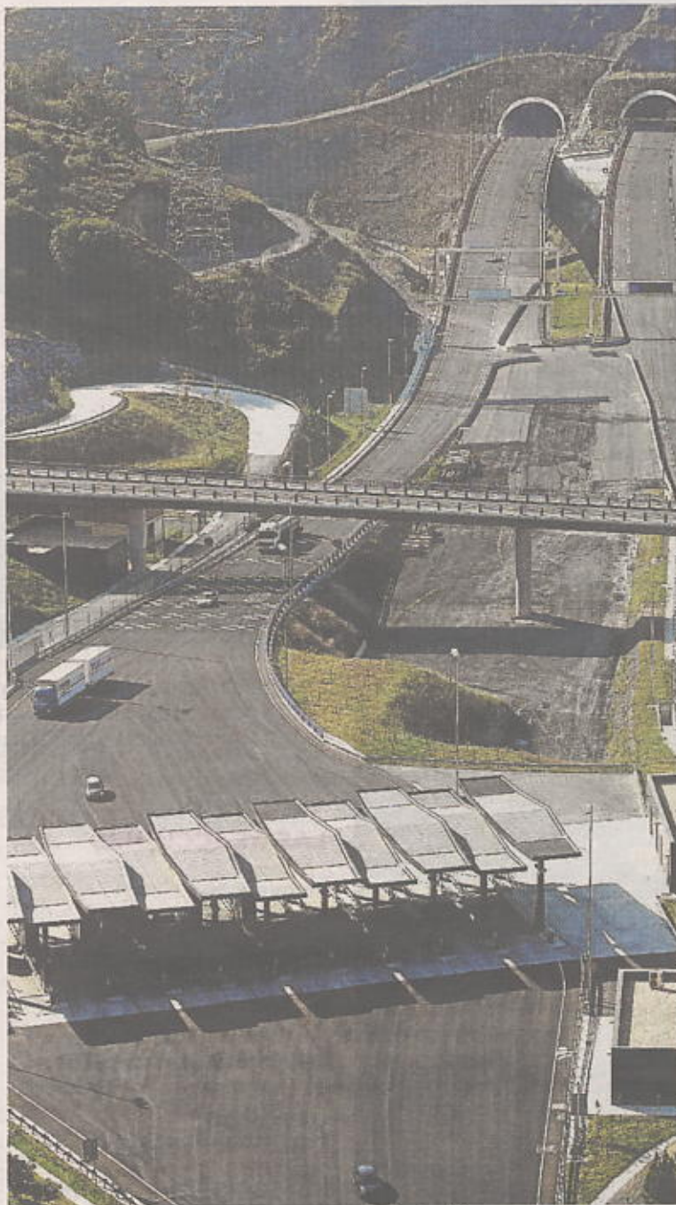
Con los peajes de este año se recaudarán 6 millones.