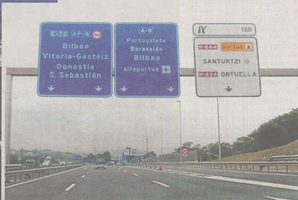
La Supersur apenas tiene clientes por las noches (izquierda). Si se circula desde Santander por la A-8, en dirección a Vitoria, la señalización canaliza el tráfico hacia la nueva autopista.

admitió que el primer año de vida de la carretera se cerraría con un déficit importante en el número de clientes previsto –las primeras estimaciones hablaban de 24.000 validaciones al día frente a las 11.000 registradas a comienzos de año– y, en consecuencia, con un abultado desfase económico.